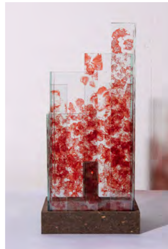
SKYLINE • BEIJING • PIÈCE UNIQUE Empreintes Hortensias