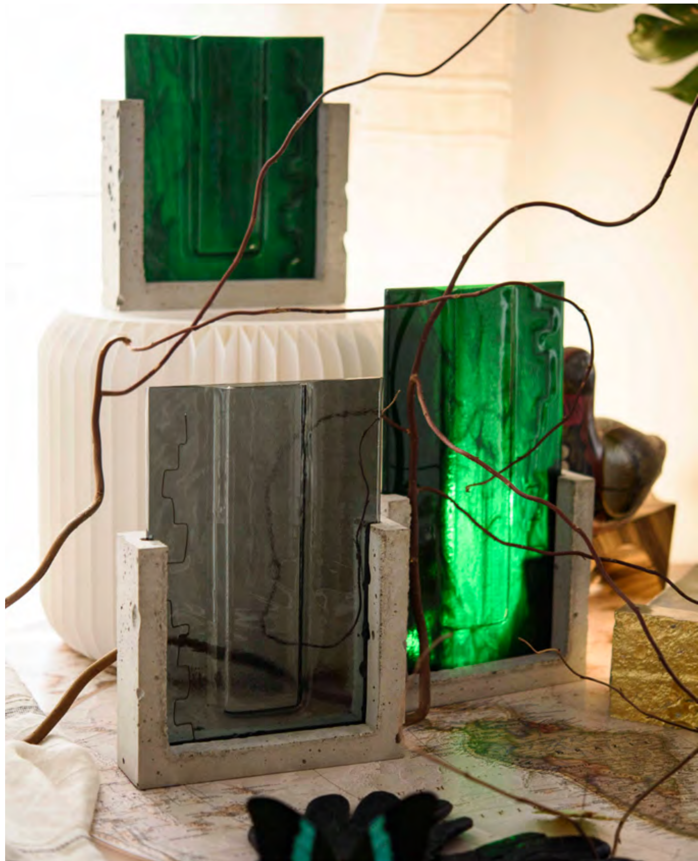
CANOPÉE • AUYAN TEPUY | MEDELLIN • TRIPTYQUE 1600 €