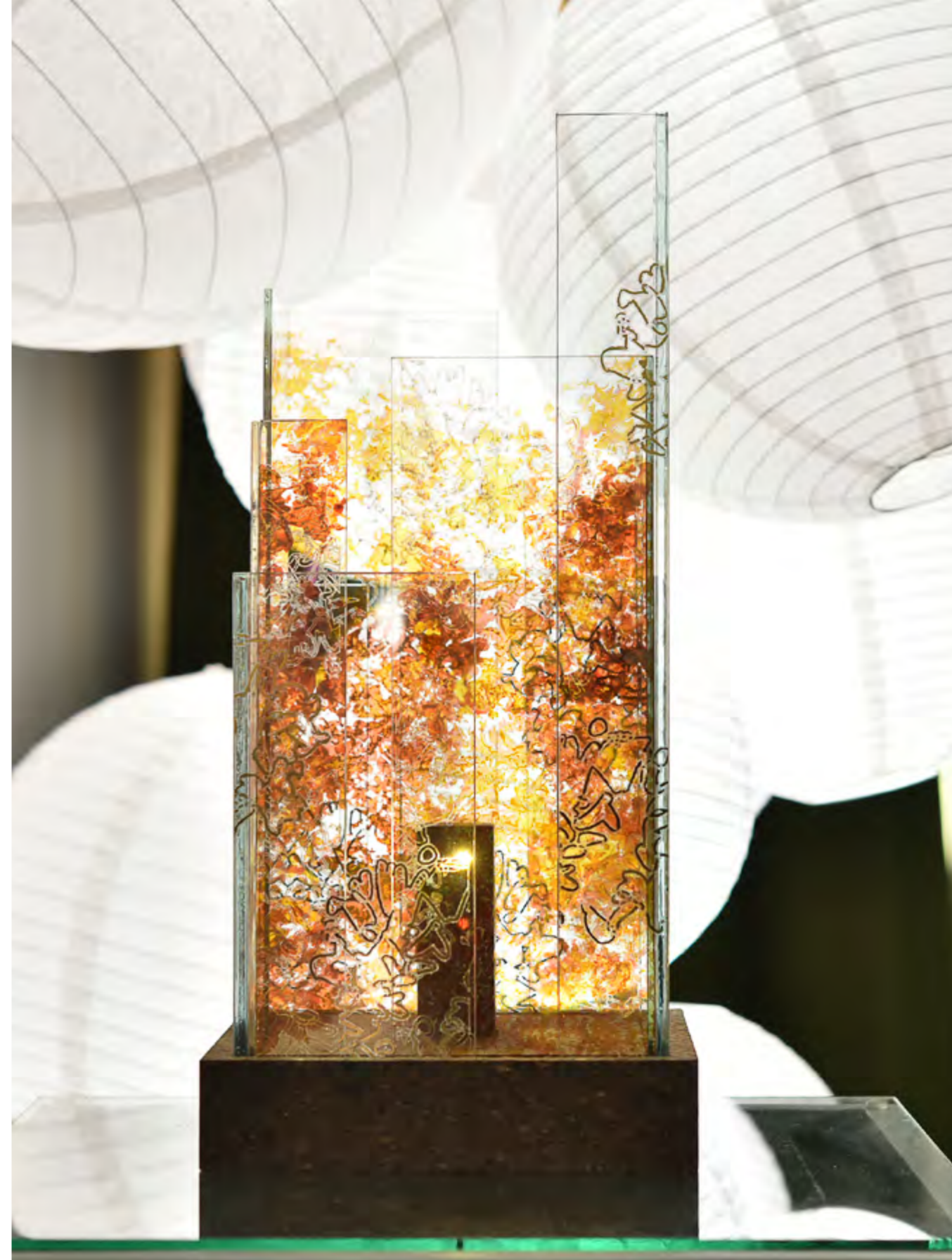
SKYLINE • NEW-YORK • PIÈCE UNIQUE • Empreintes Œillet | Or liquide • 23 x 23 x 45 cm