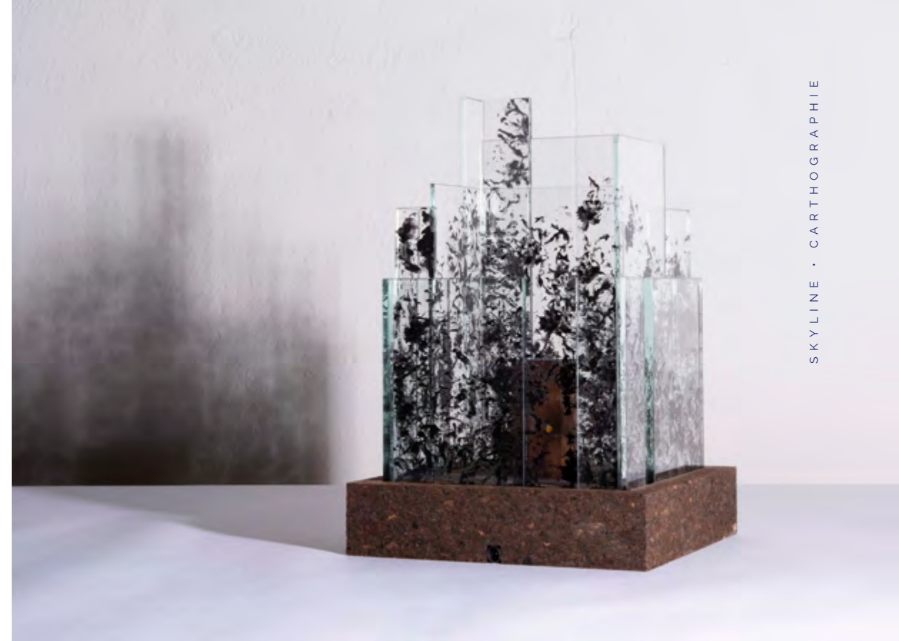
SKYLINE • PAMUKKALE • PIÈCE UNIQUE Empreintes Dahlia