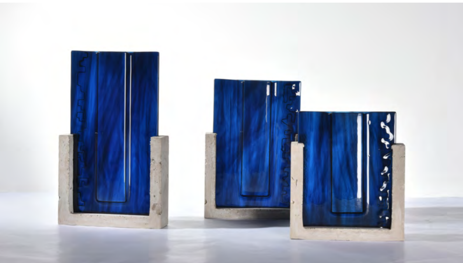
CANOPIÉE · ROARING FORTIES · TRIPTYQUE