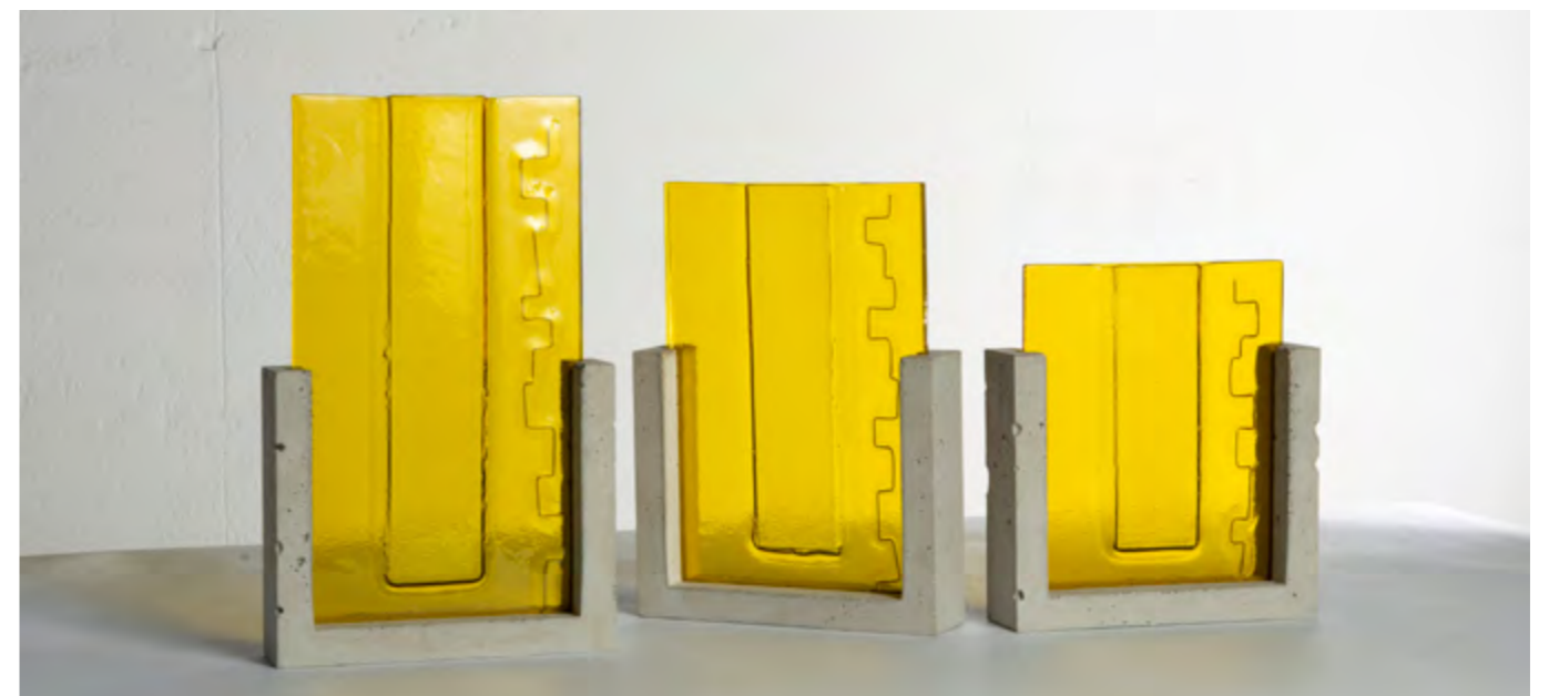
CANOPÉE • TERRA DEL FUEGO • TRIPTYQUE