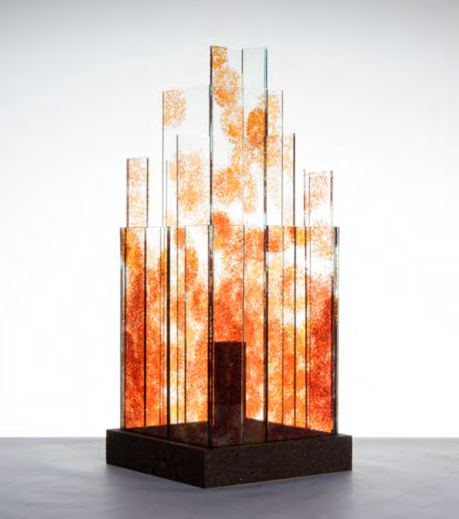
SKYLINE • GRENADE • PIÈCE UNIQUE • Empreintes Chrysanthème • 24x24x63 cm