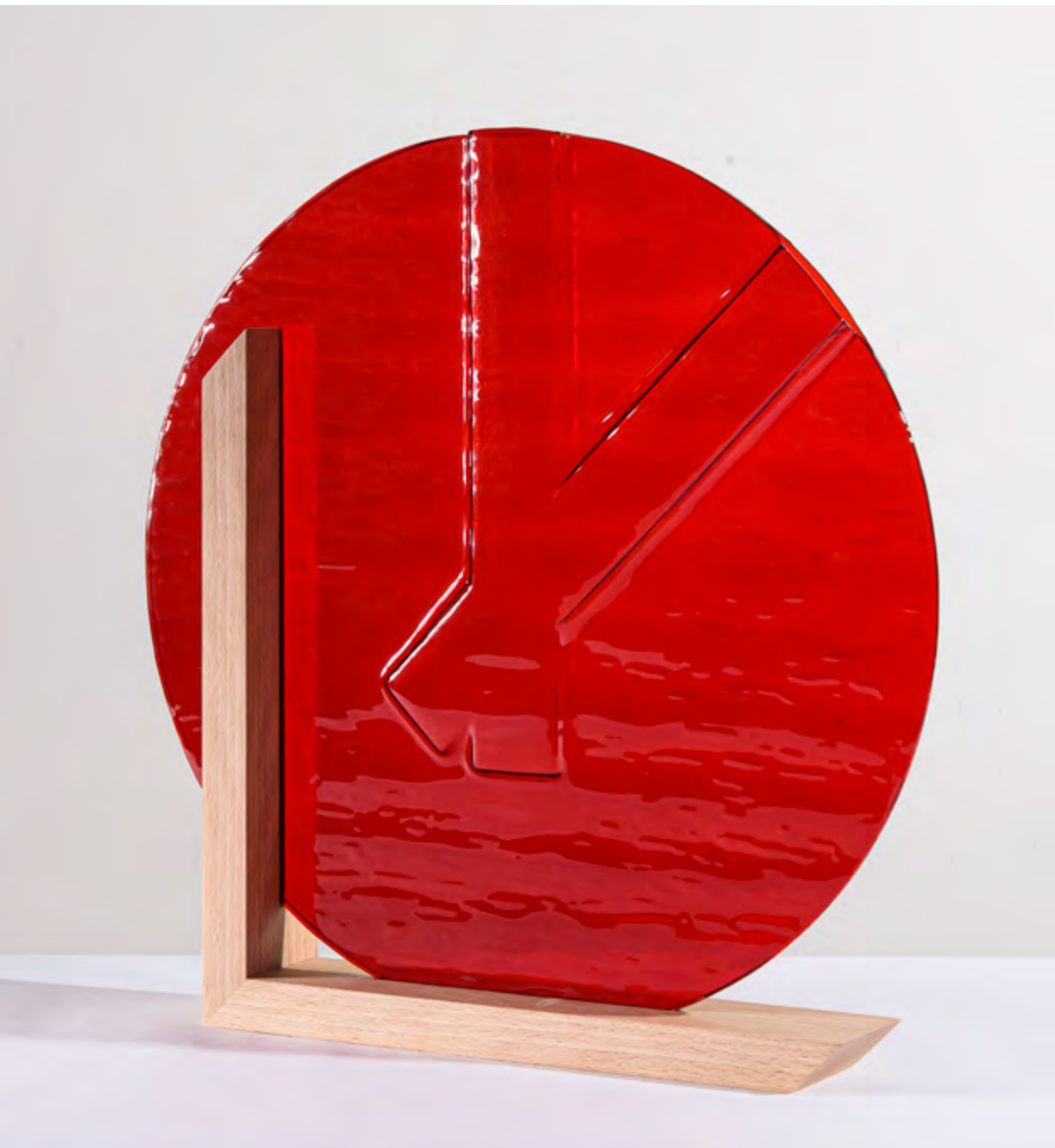
TIME • TONGA • PIÈCE UNIQUE • 51x8x51cm • Rouge transparent