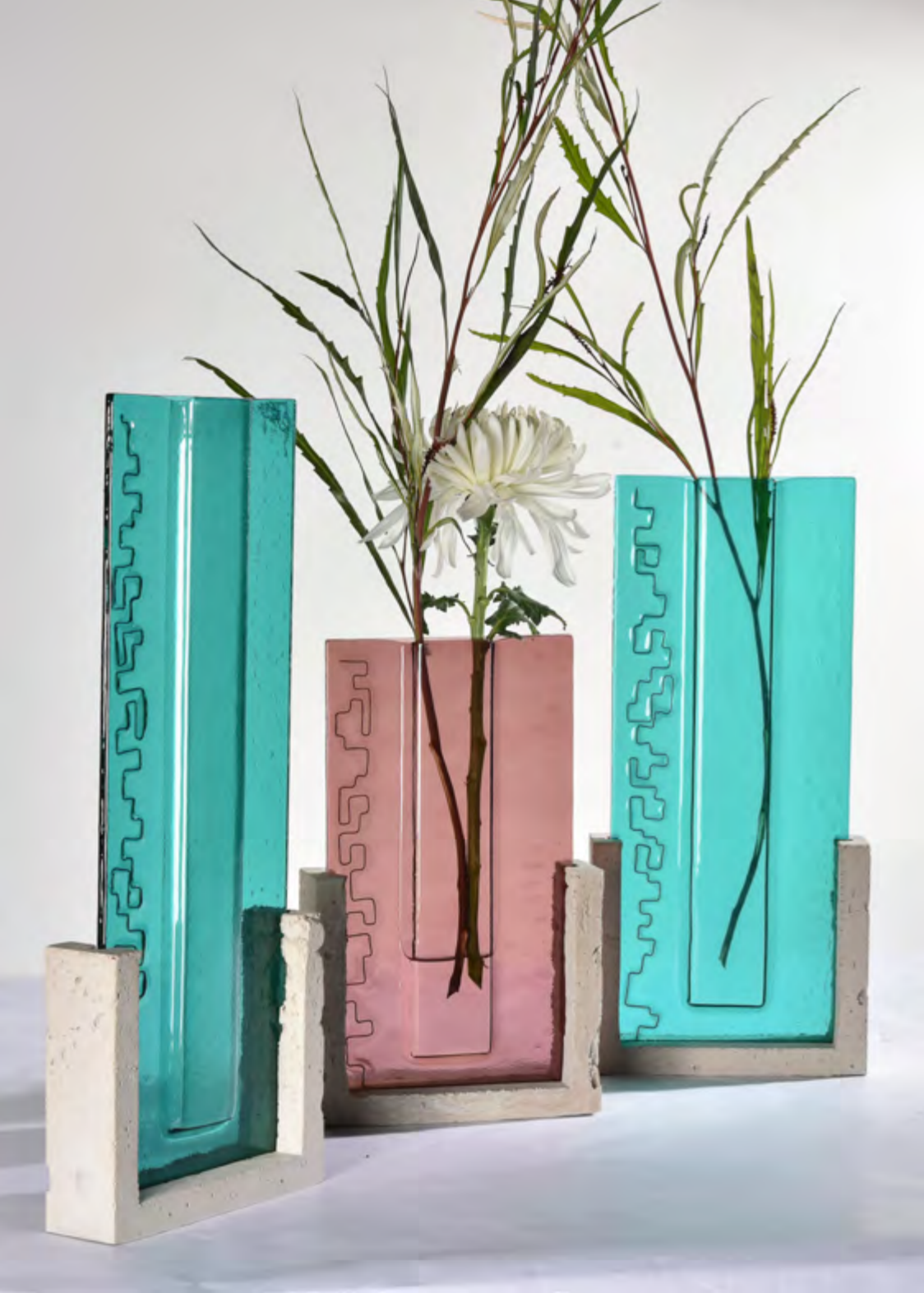
CANOPÉE • RETBA | HOLLETOWN • TRIPTYQUE