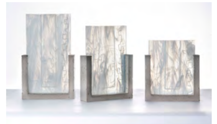
CANOPÉE • KIRKENES • TRIPTYQUE