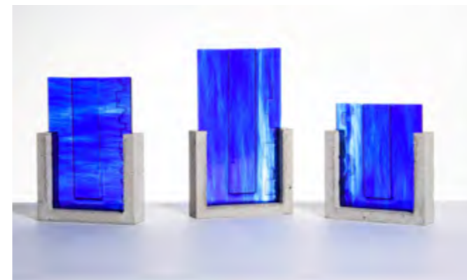
CANOPÉE • SANTORINI • TRIPTYQUE