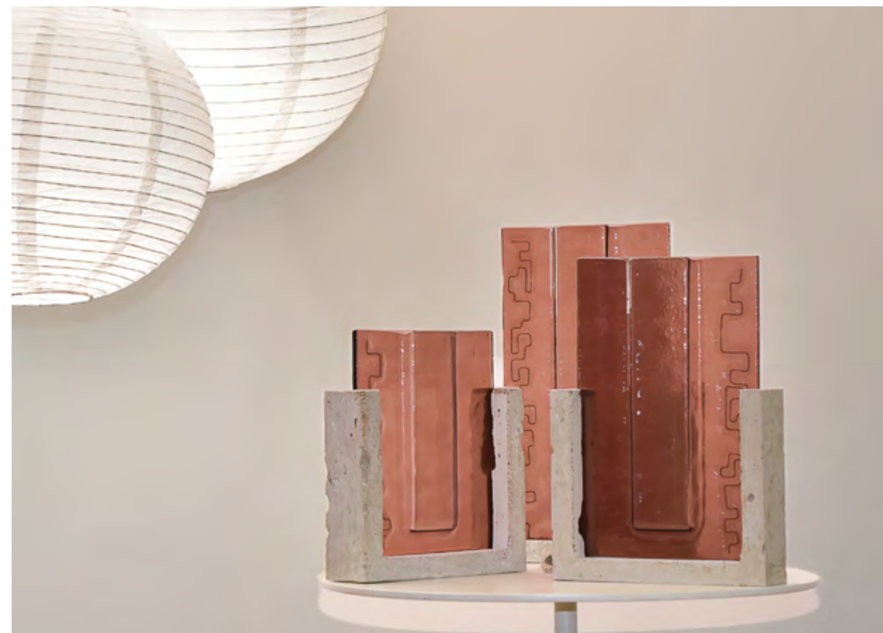
CANOPIÉE · RETBA · TRIPTYQUE