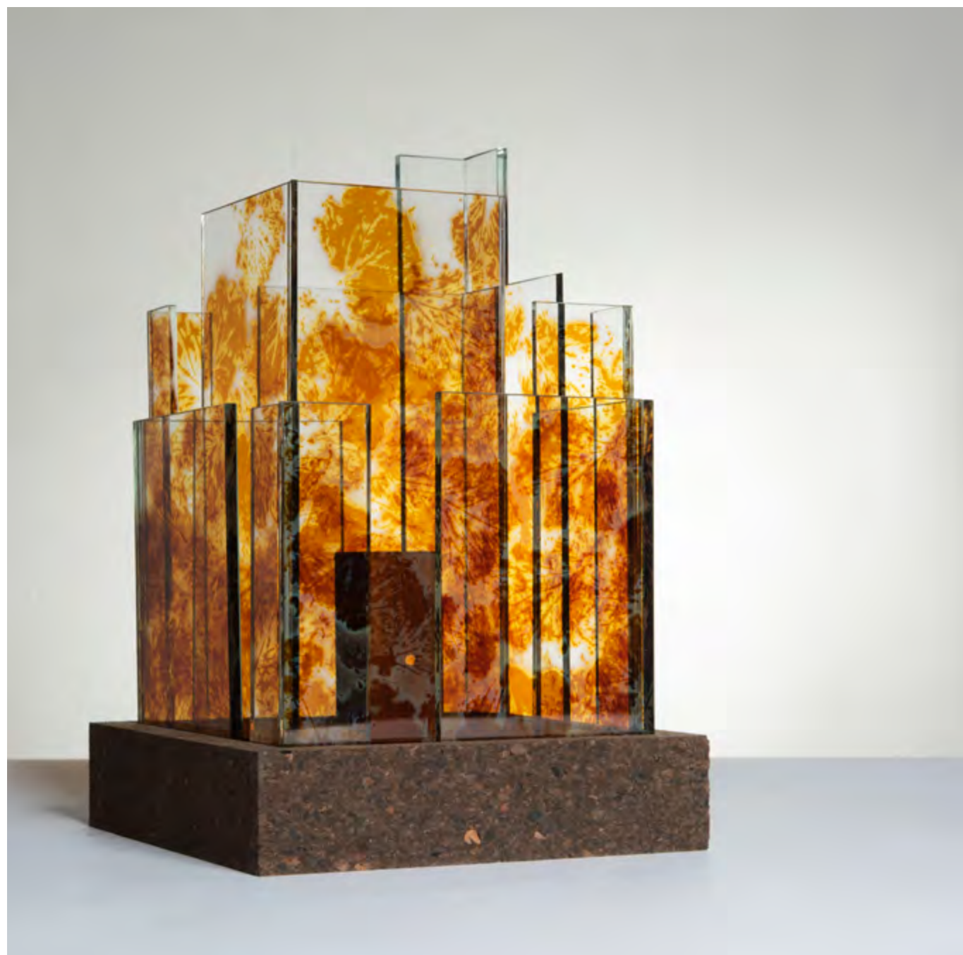
SKYLINE • IZAMAL • PIÈCE UNIQUE • Empreintes Choux • 22 x 22 x 31 cm