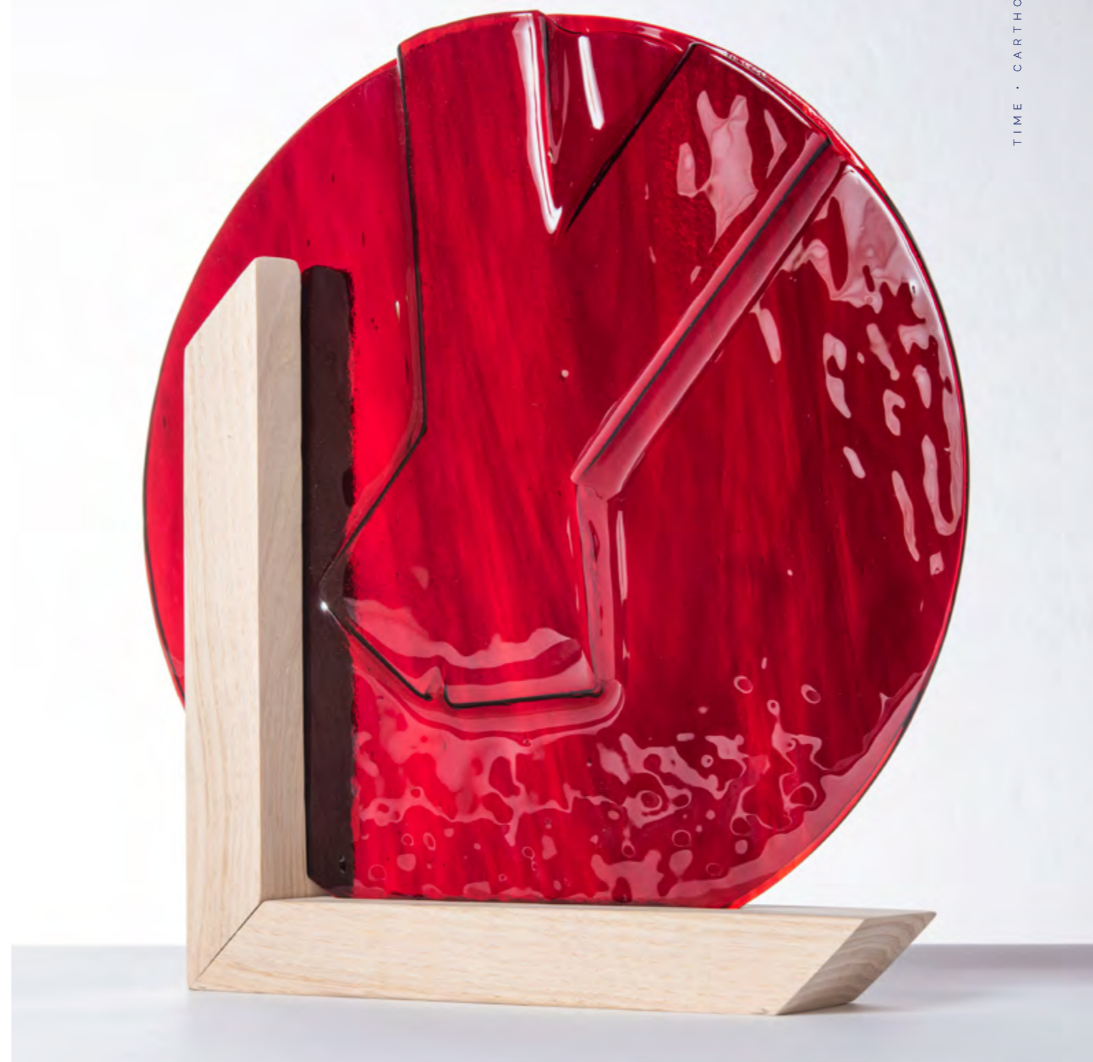
TIME • BLOOD FALLS • PIÈCE UNIQUE • 31x5x31cm • Rouge texturé