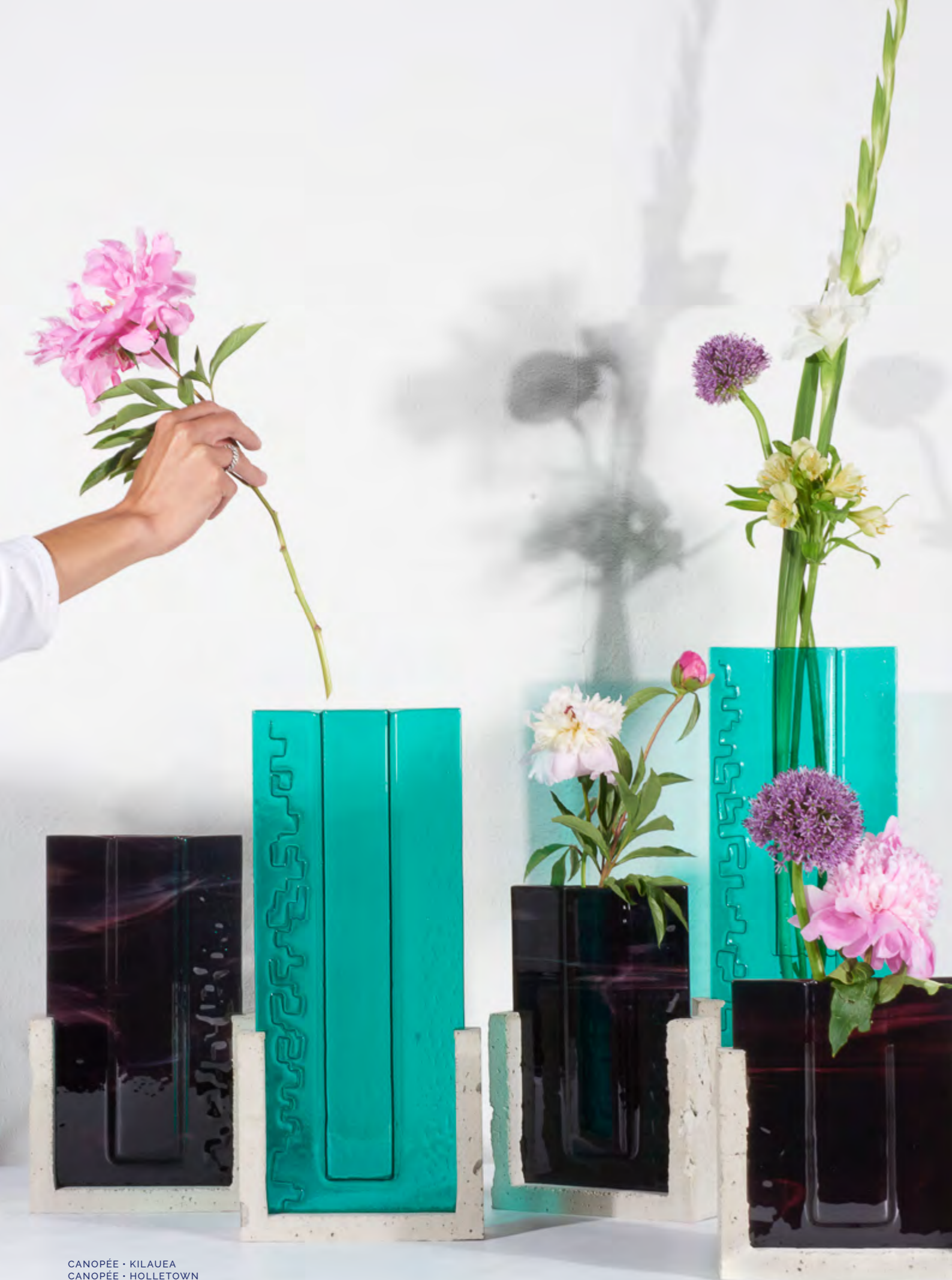
CANOPÉE · KILAUEA CANOPÉE · HOLLETOWN