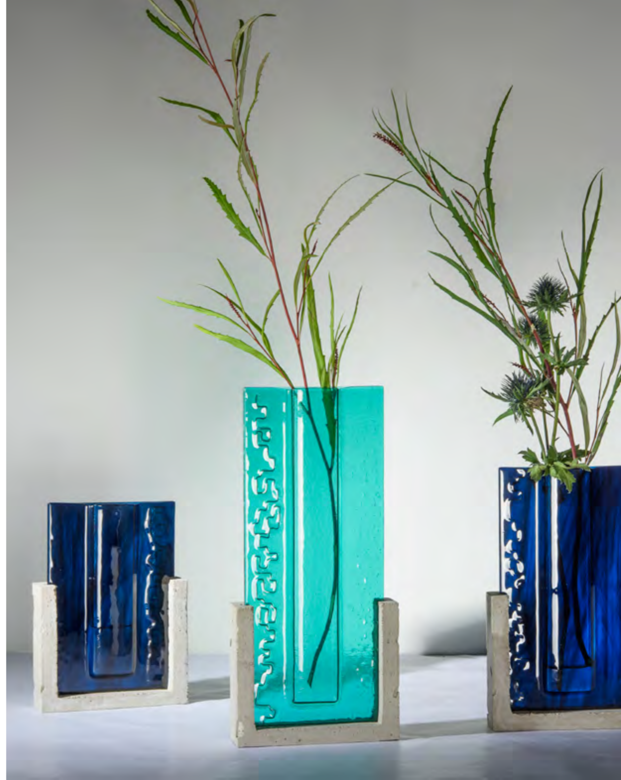
CANOPÉE • ROARING FORTIES | HOLLETOWN • TRIPTYQUE