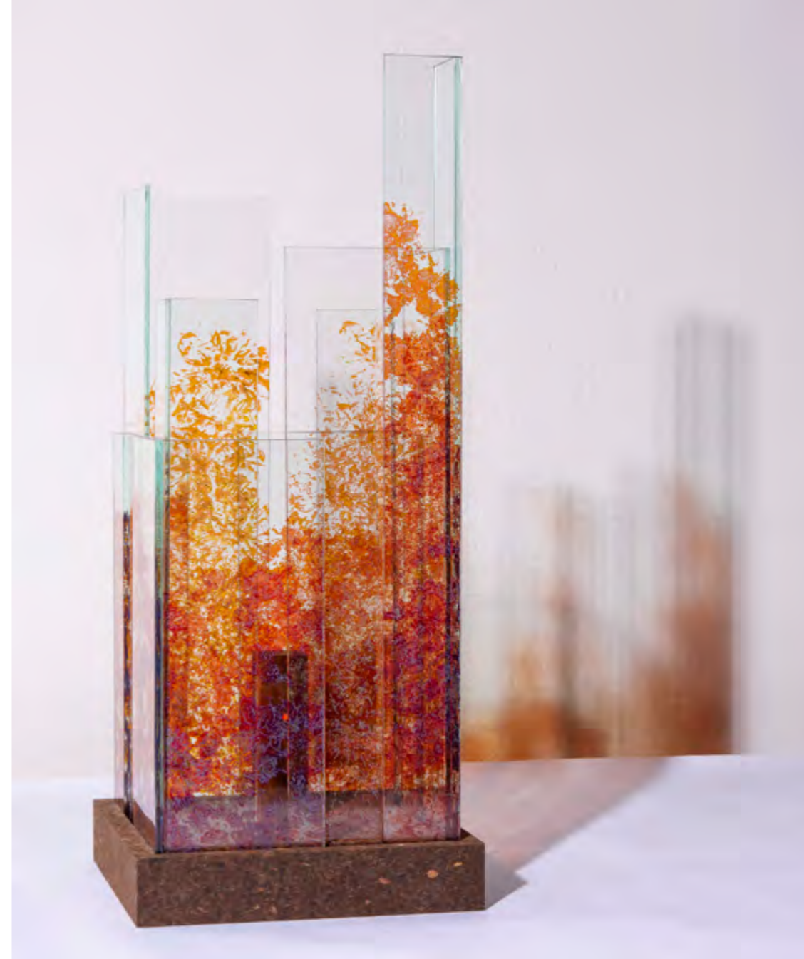
SKYLINE • DELHI • PIÈCE UNIQUE 4 900 € • Empreintes Dahlia • 24x24x63 cm