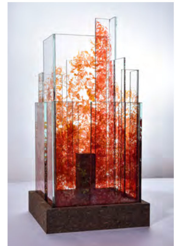
SKYLINE • LAS VEGAS • PIÈCE UNIQUE Empreintes Dahlia