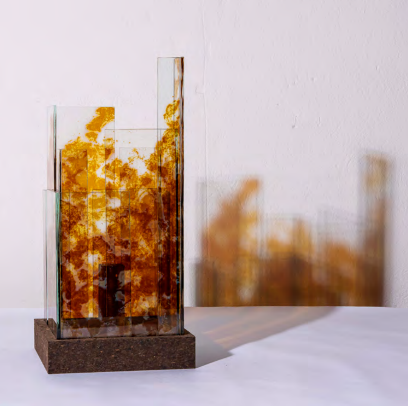
SKYLINE • CUZCO • PIÈCE UNIQUE 4 100 € • Empreintes Glaïeul • 23x23x45 cm